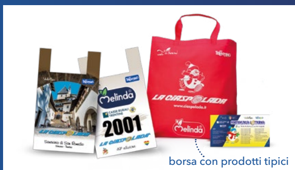
borsa con prodotti tipici